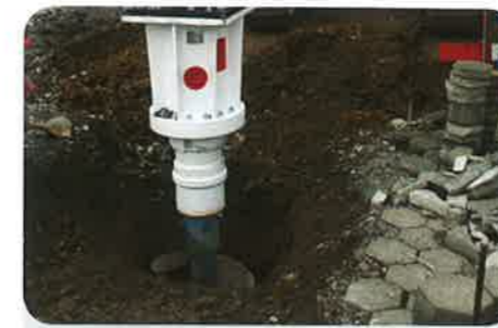
+ ADU AUGER DRIVE UNIT への変更が可能